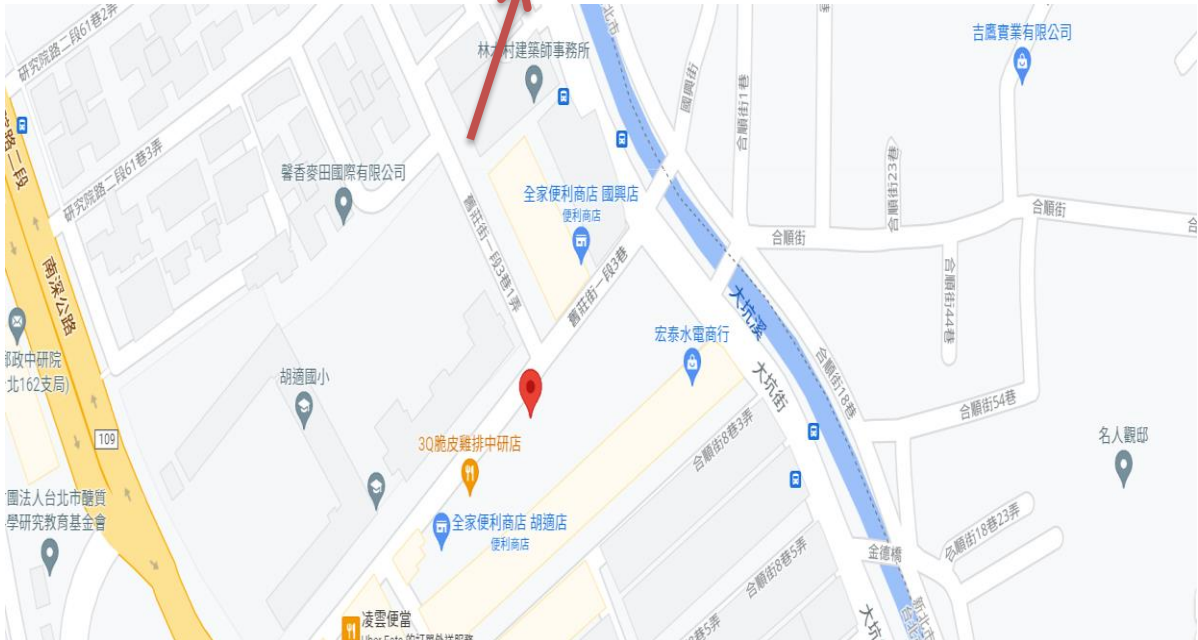
中南社會住宅(社宅周邊圖)