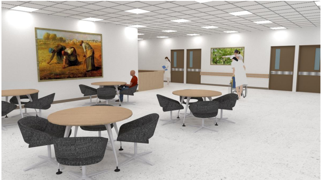
上為老人長期照顧機構示意圖