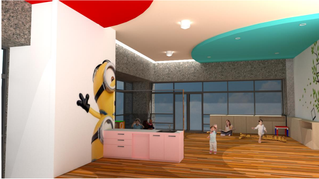
上為社區公共托育家園示意圖