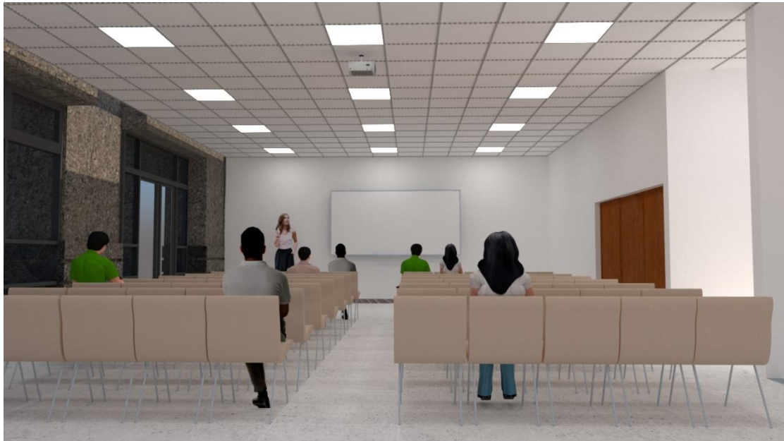
上為區民活動中心示意圖