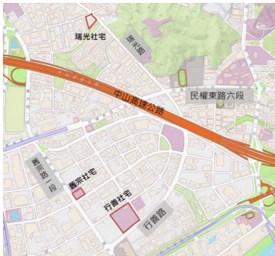
圖1 基地位置及建築模擬示意圖